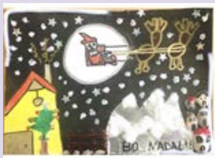
Clase de 6º de Infantil