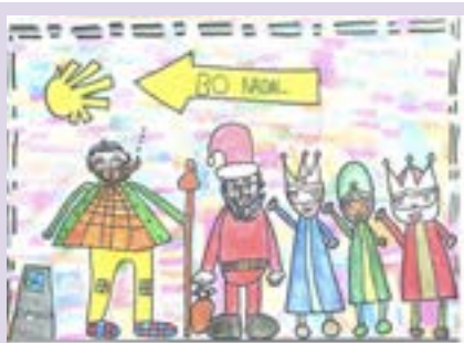
Clase de 2º de Primaria